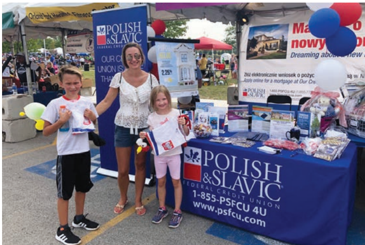
Stoisko Naszej Unii na festiwalu Taste of Polonia w Illinois PSFCU stand at the Taste of Polonia Festival in Illinois

Od lat stało się już tradycją, że Polsko-Słowiańska Federalna Unia Kredytowa sponsoruje największe polonijne festiwale na Wschodnim Wybrzeżu oraz Środkowym Zachodzie USA. Nie inaczej było w roku 2021. PSFCU była obecna, m.in. na festiwalu tygodnika PLUS w Tappan, NY, Polonijnym Festiwalu w Amerykańskiej Częstochowie w Doylestown, PA czy na Festiwalu Taste of Polonia w Illinois.