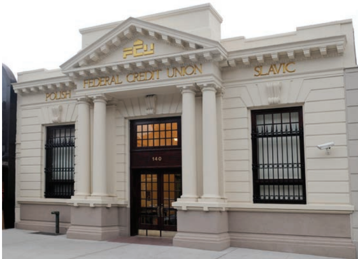
Pierwsza główna siedziba PSFCU / First PSFCU headquarters

Początkowo Nasza Unia została zarejestrowana pod nazwą Przemysłowo-Handlowa Federalna Unia Kredytowa, jednak już 31 lipca 1979 roku na zebraniu przegłosowano zmianę nazwy na Polsko-Słowiańską Federalną Unię Kredytową, która została zatwierdzona przez NCUA 23 października tego samego roku. W tym samym roku Nasza Unia kupiła budynek przy 140 Greenpoint Avenue, który po remoncie, stał się w 1981 r. jej główną siedzibą.