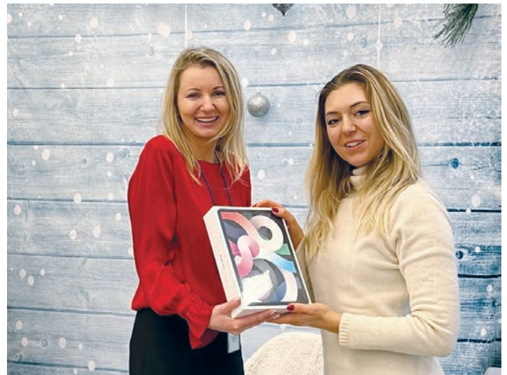
Laureatka promocyjnego losowania odbiera swoją nagrodę w oddziale w Maspeth, NY Winner of the promotional prize drawing receives her prize at the Maspeth, NY branch

On the occasion of its 45th anniversary, our Credit Union offered our members a special promotion - a drawing of 45 attractive prizes consisting of Apple products.