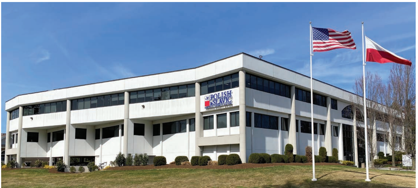
Budynek Centrum Operacyjnego PSFCU w Fairfield, NJ, w którym zlokalizowany jest nowy oddział PSFCU PSFCU Operations Center building in Fairfield, NJ, where the new branch is located

For several years, our Credit Union has been offering mortgage loans in the state of Connecticut. In September 2021, we opened a Mortgage Loan Center there, in the city of New Britain. This center serves a large Polish community in northern Connecticut. You can obtain information on mortgage loans for residential or investment properties. It is located in the center of the Polish neighborhood in New Britain, near the Sacred Heart of Jesus Parish. The exact address of the center is 38 Broad Street, New Britain, CT 06051, telephone no. 959-212-7588.