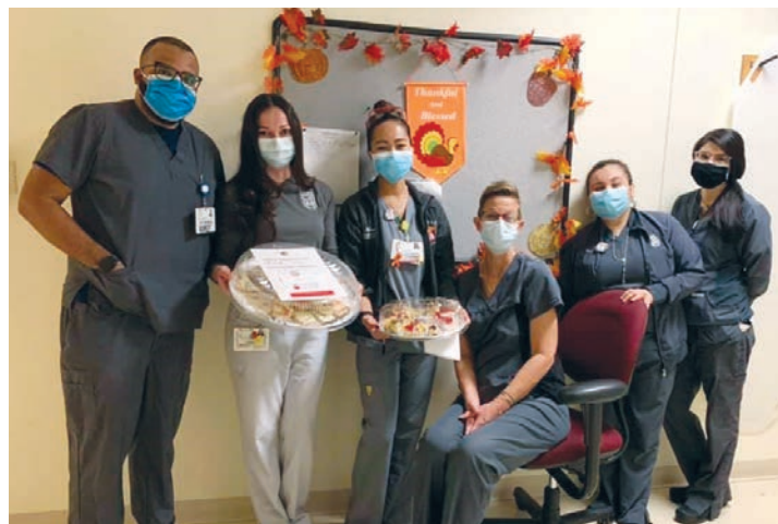
Personel szpitala Loyola Medical Center w Maywood, IL otrzymał w Święto Dziękczynienia polską żywność ufundowaną przez Naszą Unię / On Thanksgiving, personnel of the Loyola Medical Center in Maywood, IL received Polish food sponsored by our Credit Union

We also continued our support for the frontline personnel fighting the COVID-19 pandemic. For example, on Thanksgiving, volunteers of the Polish Highlanders Association in North America donated Polish food sponsored by our Credit Union to the staff of Loyola Medical Center hospitals in Maywood, IL and Edward Hospital in Naperville, IL.