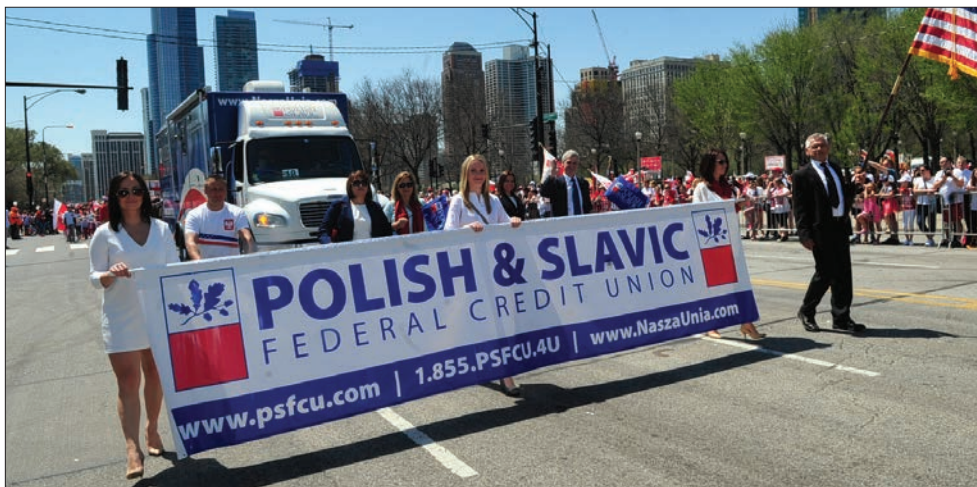
Przedstawiciele Naszej Unii podczas Parady Konstytucji 3 Maja w Chicago

5 maja br. w centrum Chicago odbyła się 127. Parada z okazji święta Konstytucji 3 maja. Jak co roku Polonia świętowała rocznicę uchwalenia Konstytucji 3 Maja oraz dodatkowo setną rocznicę odzyskania niepodległości.