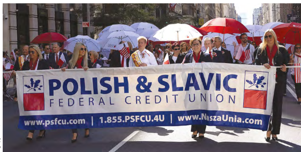
Kontyngent Naszej Unii z Anitą Włodarczyk podczas Parady Pułaskiego na nowojorskiej 5. Alei PSFCU Contingent marches with Anita Włodarczyk along New York's Fifth Avenue during the Pulaski Parade